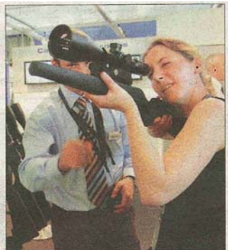
A Quick Look: A visitor peers through the sight of a rifle displayed at the Zeiss booth at Eurosatory June 12.

Eurosatory 欧州の陸軍展示会、 カールツァイスの光学のついたライフルを手に