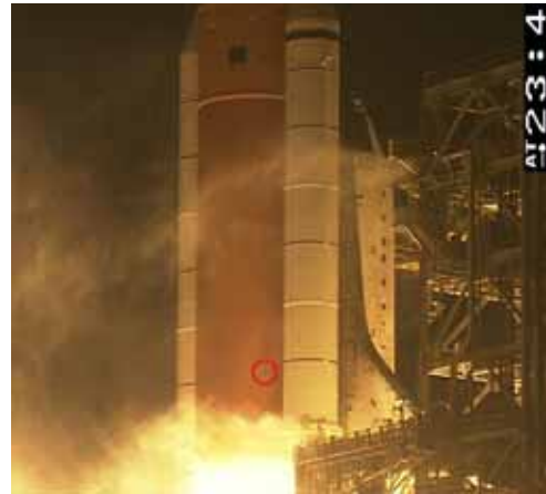
This free tail bat was hanging on to space shuttle Discovery as the countdown proceeded.