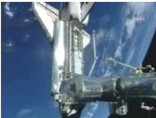
* S15, * S17

ステーションにドッキングしたシャトル18日 - 9時42分 * S15